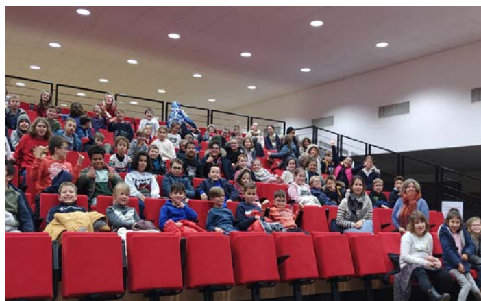
Projection de «mon voisin Totoro» à la salle Escapade (merci encore à la municipalité) (mardi 19 décembre)