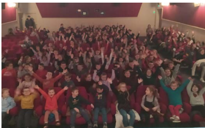
Découverte de «Wallace et Gromit» dans le cadre du dispositif école et cinéma (lundi 11 décembre)