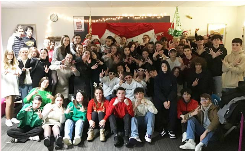
Élèves de 3 ème à Noël lors de l'atelier photobooth

► Forum des métiers organisé pour les élèves de 4 ème