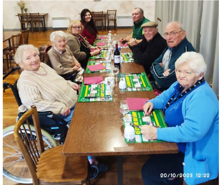
▲ Un petit restaurant

Le 23 septembre, les résidents et leurs familles, entourés des agents et des invités... Ce qui représente environ 200 personnes.