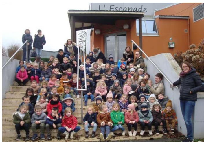
▲ Toute l'école : cinéma de Noël à la salle polyvalente le 19/12/23.