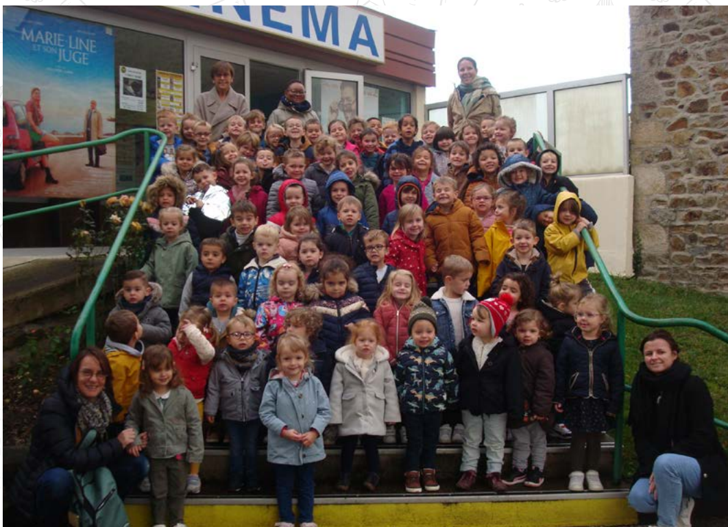
Toute l'école : première séance au cinéma de Lamballe le 09/11/23.