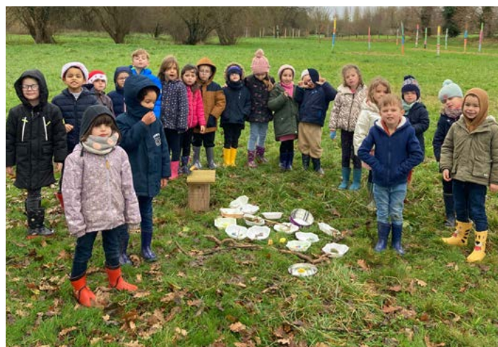
▲ GS de Florence BADOUARD : école dehors 1 jeudi matin par mois.