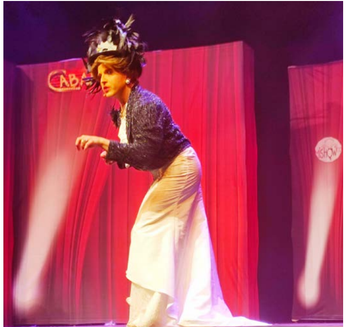
Sortie au théâtre des Jacobins le 12 décembre 2023

▼ Le 13 décembre, les résidents de l'EHPAD et de la résidence autonomie, conjoint de résident, agents, direction, élus... ont partagé le repas de Noël. Un animateur a mis l'ambiance jusqu'en fin d'après-midi. Belle organisation. MERCI A TOUS