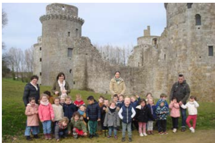
Visite du Château de le Hunaudaye à Plédéliac le 16 mars (TPS-PS-MS)