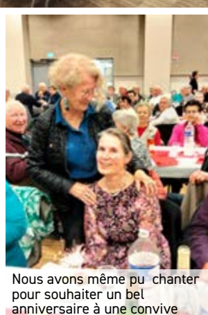
Nous avons même pu chanter pour souhaiter un bel anniversaire à une convive

▲ Ce 23 mars, fut un bel après-midi pour grand nombre d'entre nous. Un repas de choix cuisiné par «Le Chêne au Loup».