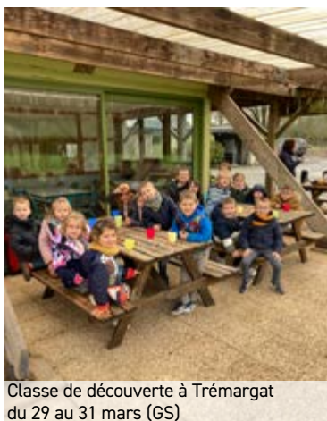
Classe de découverte à Trémargat du 29 au 31 mars (GS)

Randonnée à Plénée-Jugon puis pique-nique au city stade avec les enfants de l'école élémentaire le 3 juillet (toute l'école).