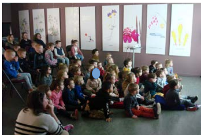
Semaine du court-métrage à la médiathèque le 21 mars (toute l'école)