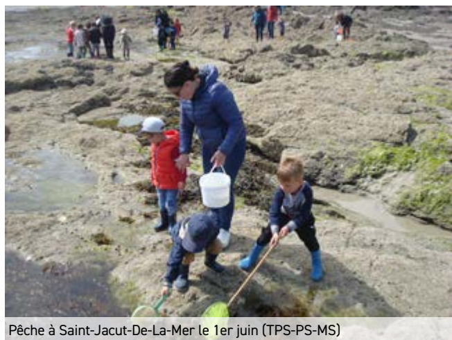
Pêche à Saint-Jacut-De-La-Mer le 1er juin (TPS-PS-MS)