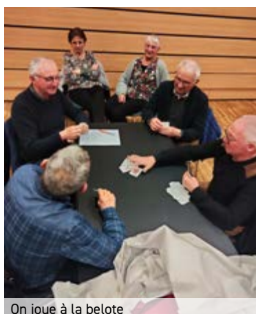
On joue à la belote