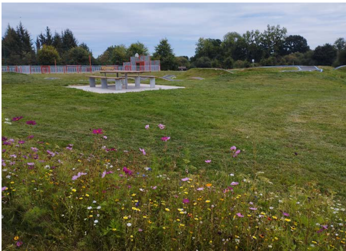
La Vallée de l'Arguenon

6 et 20 octobre, 3 et 17 novembre, 1 er et 15 décembre.