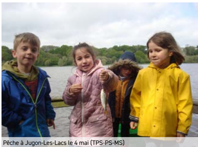
Pêche à Jugon-Les-Lacs le 4 mai (TPS-PS-MS)