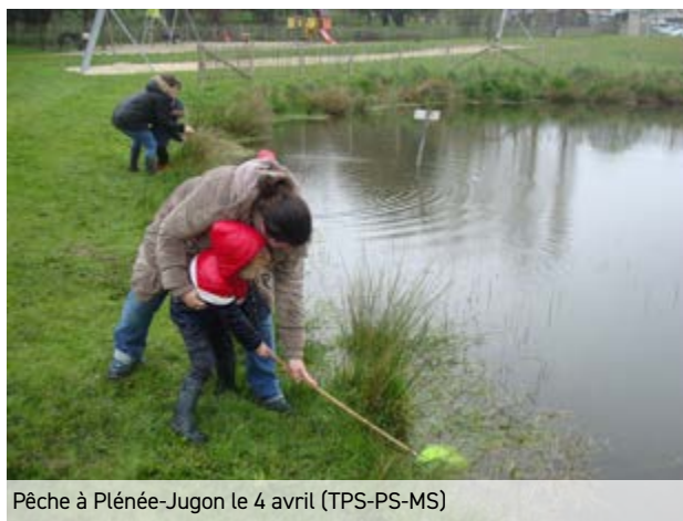
Pêche à Plénée-Jugon le 4 avril (TPS-PS-MS)